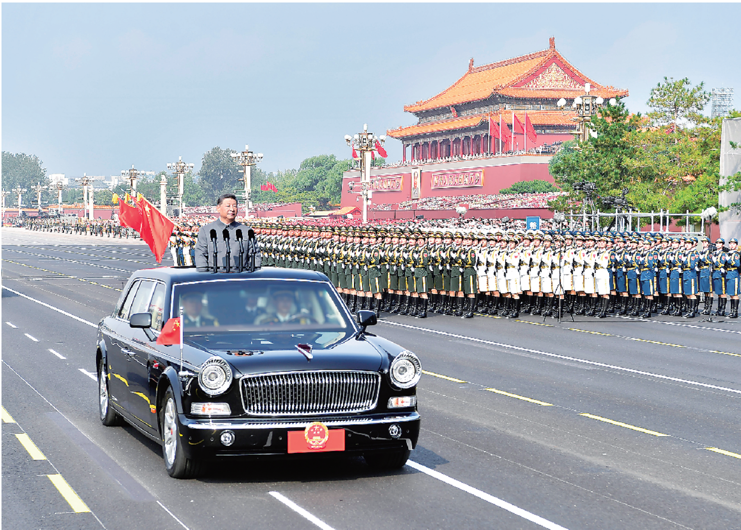
9月3日，纪念中国人民抗日战争暨世界反法西斯战争胜利80周年大会在北京天安门广场隆重举行。这是中共中央总书记、国家主席、中央军委主席习近平检阅受阅部队。

新华社北京9月3日电 铭记伟大历史胜利，凝聚正义和平力量。9月3日上午，纪念中国人民抗日战争暨世界反法西斯战争胜利80周年大会在北京天安门广场隆重举行，以盛大阅兵仪式，同世界人民一道纪念这个伟大的日子，共同开创更加光明的未来。中共中央总书记、国家主席、中央军委主席习近平发表重要讲话并检阅受阅部队。 中共中央政治局常委李强主持大会。中共中央政治局常委赵乐际、王沪宁、蔡奇、丁薛祥、李希，国家副主席韩正出席大会。61位外国国家元首、政府首脑及有关国家高级别代表、国际组织负责人、前政要等出席大会。 首都北京，花团锦簇，旌旗飘扬。天安门城楼庄严雄伟，天安门广场气象恢宏。人民英雄纪念碑前，“钢铁长城”主题景观巍然矗立，14座烽燧托举起“1945”“2025”字样，14只“和平鸽”振翅飞翔。从空中俯瞰，广场中“众”字造型观礼台蔚为壮观，象征着在中国共产党领导下中国人民万众一心、众志成城，向着中华民族伟大复兴昂扬奋进。 上午8时35分，习近平同出席大会的外方代表团团长拾级而上，登上天安门城楼。习近平同抗战老战士老同志代表亲切握手，向他们表示崇高敬意。 《松花江上》《在太行山上》《保卫黄河》《没有共产党就没有新中国》，一首首诞生于抗战烽火中的经典歌曲连唱，让大家重温中华民族那段艰苦卓绝、气壮山河的峥嵘岁月。 8时55分，习近平等中外领导人来到天安门城楼主席台，全场爆发出雷鸣般的掌声。电子屏幕上出现钟摆的画面。随着钟摆，1945、1955、1965……2025的年份数字依次显现。9时整，报时钟声响起，纪念大会开始。