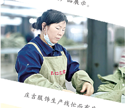
庄吉服饰生产线忙而有序。