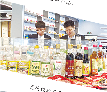
莲花控股产品展示。