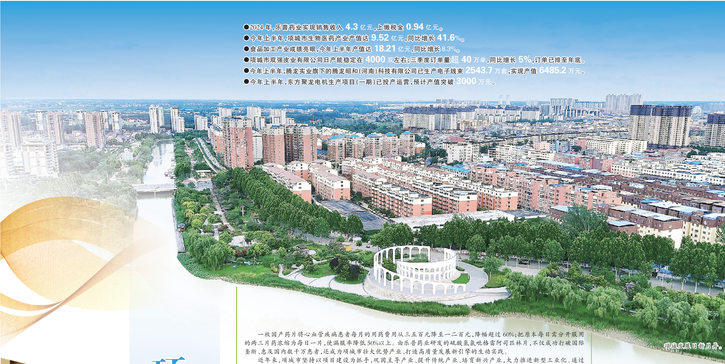
项城发展日新月异。

一枚国产药片将心血管疾病患者每月的用药费用从三五百元降至一二百元,降幅超过 60%;把原本每日需分开服用的两三片药浓缩为每日一片,使漏服率降低 50%以上。由乐普药业研发的硫酸氢氯吡格雷阿司匹林片,不仅成功打破国际垄断,惠及国内数千万患者,还成为项城市壮大优势产业、打造高质量发展新引擎的生动实践。 近年来,项城市坚持以项目建设为抓手,巩固主导产业、提升传统产业、培育新兴产业,大力推进新型工业化。通过创新驱动挖掘产业新增长点,强链补链,壮大产业集群,培育竞争新优势,走出一条特色产业高质量发展道路。