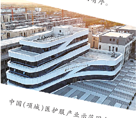
中国(项城)医护服产业示范园鸟瞰图。