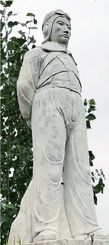
位于商水县苏坡村的高志航雕像。