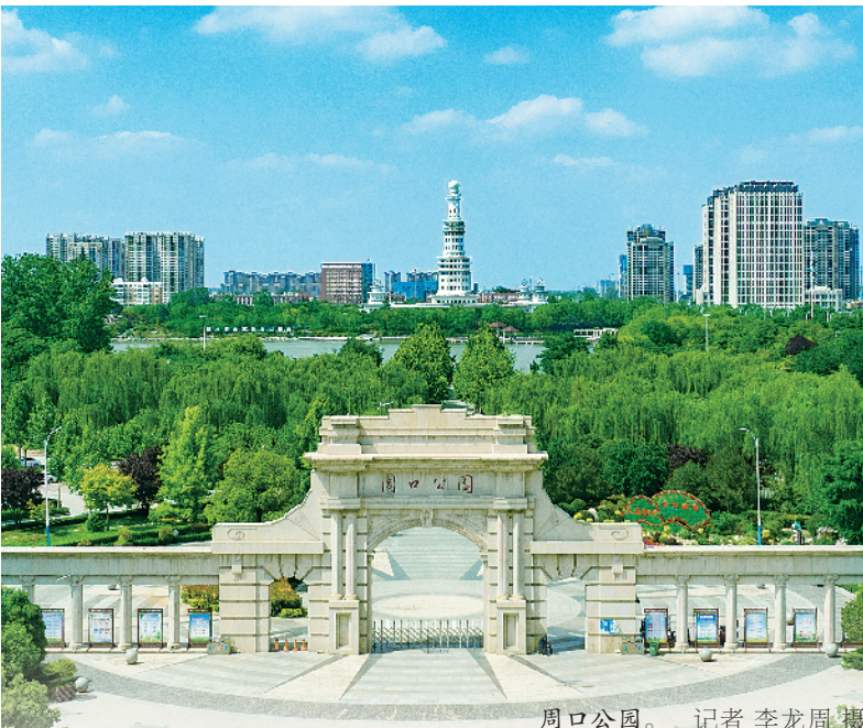
周口公园。