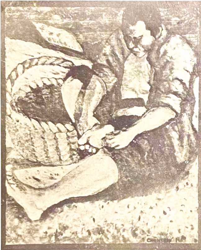
胡蜜的革命油画《拔刺》(1928 年)。

涌进城市却因找不到工作而流落街头的短篇小说《进城》,发表于上海《南国》等报刊。 同年夏,胡蜜得知北平艺专改名为国立北平艺术学院,并由徐悲鸿出任院长,遂连夜乘火车赶回北平,入校继续学习。在徐悲鸿悉心指教下,他的绘画技艺提高很快,并被推举为学生自治会常务委员。此时胡蜜非常喜爱阅读鲁迅翻译的作品,这对他产生了深远的影响。 1929 年夏,胡蜜在国立北平艺术学院毕业,并以第一名的成绩留校任教。7 月,学校资助胡蜜等人到日本东京考察艺术。在日本,他们举办小型绘画展览,参观美术学校、美术博物馆等;胡蜜访问日本左翼美术家联盟,并拜会日本左翼作家。 自 1929 年秋季起,胡蜜在国立北平艺术学院任教,当时有许多进步学生接近他。受日本左翼文艺运动影响,他组织发起“青年文艺家学会”“画工同盟”等左翼文艺团体,积极为进步文艺刊物绘制封面插图,创作革命题材绘画,并阅读马克思主义文艺理论书籍,参与国内外时事讨论。1930 年冬,胡蜜加入“左翼美术家联盟”。1932 年春,北平左翼文化运动蓬勃发展,“北平社联”“北平剧联”“北平美联”等团体相继成立。在“北平美联”成立大会上,胡蜜当选常委。同年 5 月,中共北平市委为加强对各文化团体的统一领导,决定成立北平文化总同盟(简称“北平文总”),胡蜜在秘密举行的成立大会上当选执行委员。 从得心应手的绘画转向美术理论研究,对胡蜜而言不啻于新辟赛道。他受屈原“路漫漫其修远兮,吾将上下而求索”激励,全身心投入美术理论研究,夜以继日研读中外美术论著,先后读过列宁、高尔基论艺术的文章,还涉猎《苏联文学》《莫斯科周报》上刊登的相关论文。在美术作品方面,无论是德国表现主义画派的作品,还是我国传统的美术作品,他都注重批判地吸收和借鉴。在此基础上,胡蜜完成了重要美术学术论著《辩证法美学十讲》。该书当时在北平出版发行后,影响颇大,它进一步开拓了我国美术理论研究领域,更首次在方法论层面实现了一次革命性转变。 当时的美术理论界观念僵化,死水一潭。“北平文总”交给胡蜜一个重要任务——用马克思主义观点研究中国美术,结合中国美术的历史和现状,尽快把中国美术理论研究从形而上学的桎梏中“拯救”出来。 作为革命文艺战士,胡蜜最痛恨人剥削人的社会制度,深切同情贫苦的劳动人民。他的人生追求与信仰是:以写文作画为武器来战斗! 在热心工友的帮助下,胡蜜多次下矿井,与矿工们一起劳动、生活。严冬之中,他们用铁镐、铁铲挖呀、掘呀,而得到的工钱却很低,难以维持生活。他们饥寒交迫,却很照顾胡蜜。胡蜜和他们一起吃小米干饭、吃咸菜、喝水、蹲在