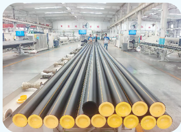
河南联塑实业有限公司生产车间一角。

近年来,淮阳区立足原有工业基础,聚焦塑料制品产业,以调结构、促转型为重点,推动产品档次、技术装备、管理水平和竞争力提升。该区已形成以河南联塑、河南银丰、瑞丰塑编、瑞云塑编等企业为龙头的塑料制品产业集群,其工程管道、食品包装、农用薄膜、文体塑料等主要产品的产销规模稳居河南省前列,并在全国同行业中具有重要影响力。淮阳,已经成为河南省塑料制品产业新坐标。