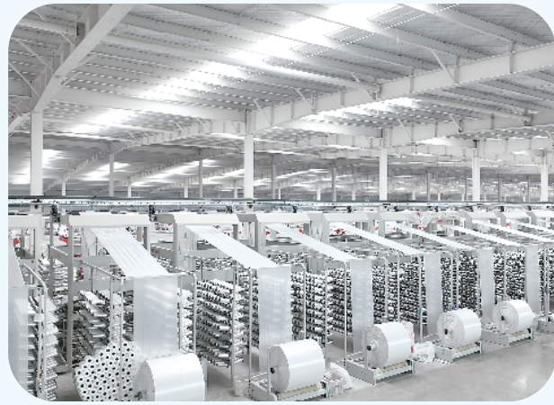
周口市钰丰包装科技有限公司生产车间。

以“新”发力、向“强”挺进,推动主导产业“起高峰”。从昔日的家庭作坊到如今的集聚发展,数字赋能,淮阳区加大政策扶持力度,优化营商环境,推进产业链延链补链,以企业数字化带动产业集群化、品牌化发展,奋力绘就塑料制品产业高质量发展新图景。