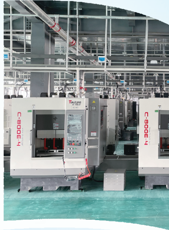
河南宇星鸿智能科技有限公司精密电子智能化生产车间。