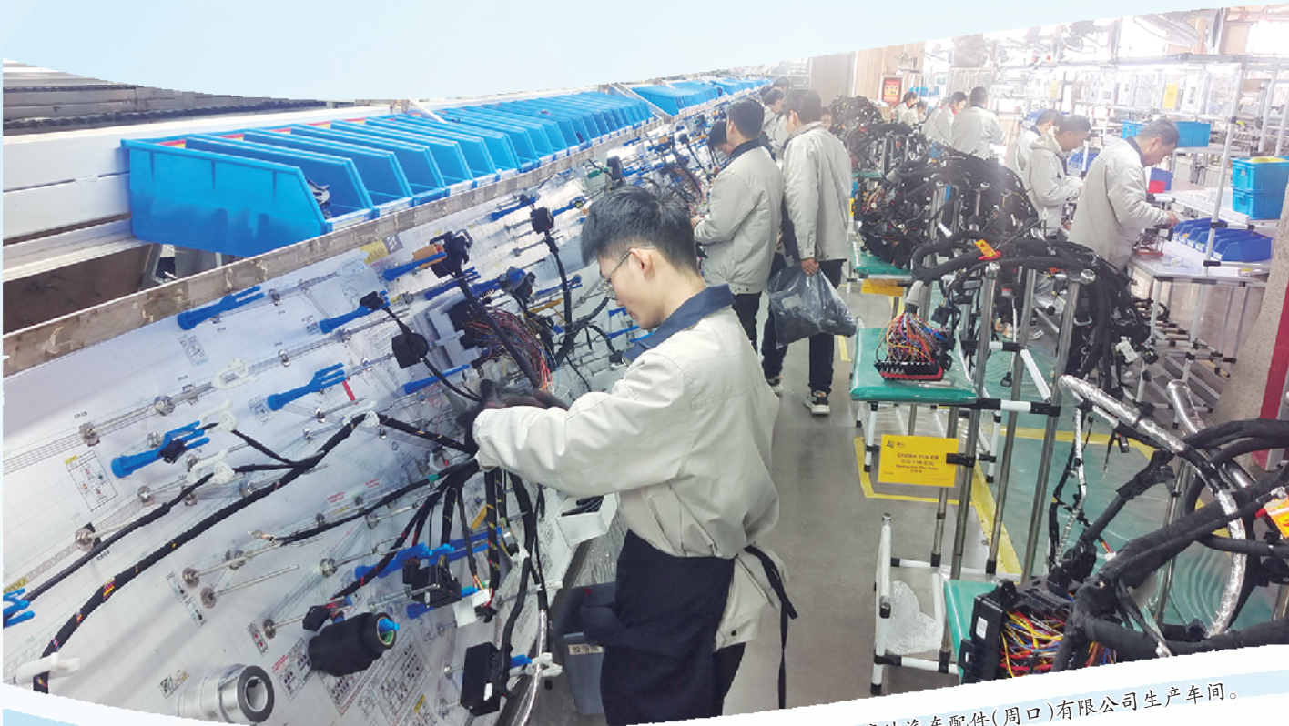
豪达汽车配件(周口)有限公司生产车间。

项目建设是稳定经济运行的“压舱石”,是拉动经济增长的“动力源”,更是产业发展的“强引擎”。今年以来,淮阳区以“起步即冲刺、开局即决战”的奋进姿态,大力抓项目、扩投资、提质效,不断刷新项目建设“进度条”,跑出项目建设“加速度”,为巩固经济稳中向好态势注入澎湃动能。