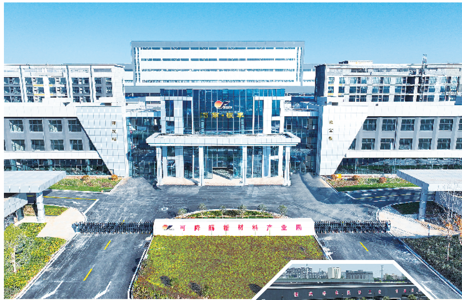
▲ 可降解新材料产业园。

另外,政策性资金项目建设也在有序推进。争取塑料制品产业园二期、区中心敬老院等专项债项目8个,金额5.58亿元,目前已完工1个,其余7个明年可完工。争取托育综合服务中心、公共实训基地等中央预算内项目7个,金额7618.8万元,目前已完工1个,其余6个明年可完工。争取功能性聚烯烃薄膜、年产26万套塑料管道管件等超长期特别国债项目5个,金额9501万元,目前正在加快推进。