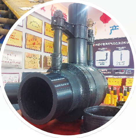
河南中恒信燃气设备股份有限公司展厅一角。