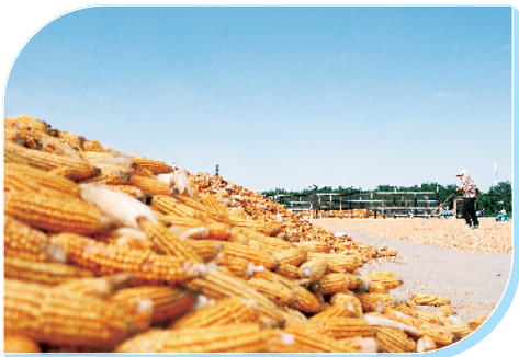
金色玉米晒满场。

从以良种繁育推动粮食产能稳步跃升,到“天—空—地”一体化智慧农业网络覆盖田野;从老街区旧貌换新颜,到黄金梨成为农民增收“金果子”;从群众办事“多地跑”,到“一站式”服务解民忧……“十四五”五载春秋,黄泛区农场党工委、管委会紧跟“两高四着力”战略航向,以农为根、以文为脉、以民为本,在这片承载着农垦记忆与时代使命的土地上,一笔一划绘就乡村振兴的鲜活图景,让产业兴、文旅活、民生暖的美好画卷处处铺展,尽显振兴图景方遒劲的蓬勃气象。