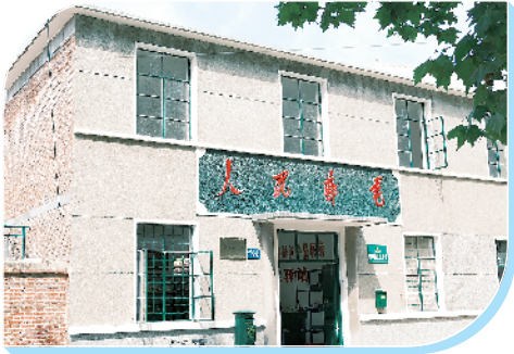
历史街底蕴浓。