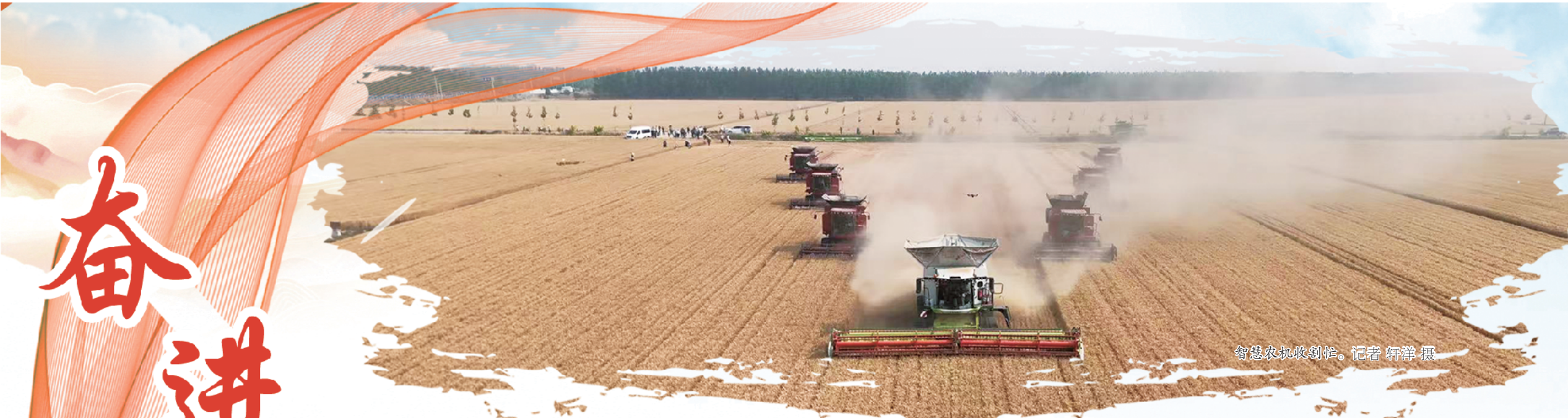
智慧农机收割忙。