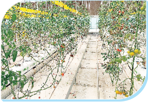
丰收果实缀满枝。