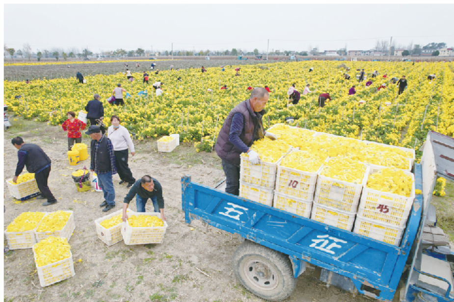
新桥镇小菊花丰收场景。王洁石 摄