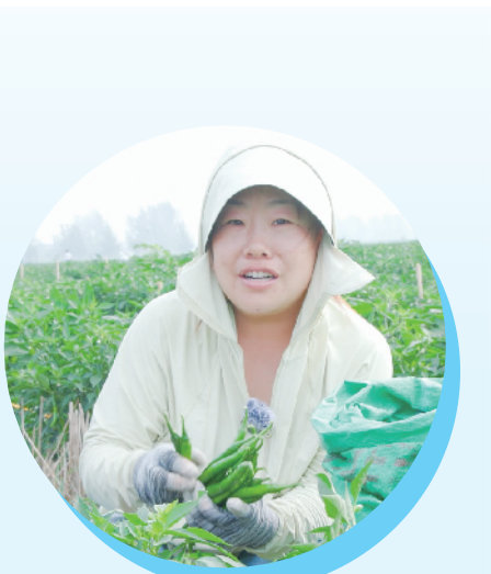
范集镇小辣椒喜获丰收。

据了解,2025 年,项城粮食作物种植面积稳定在 206.3 万亩。其中,111.14 万亩小麦,以亩均 503.19 公斤的产量,贡献了 11.184 亿斤的总产;秋季 95.16 万亩主粮,产量达 8.86 亿斤。在复杂的天气形势下,这份成绩单让“压舱石”的分量愈发厚重。