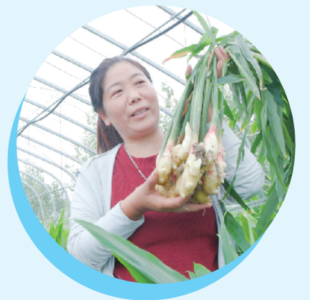
三店镇大力发展生姜产业。