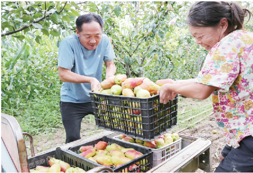
南顿镇红贵妃梨丰产又丰收。

2025 年以来,项城市在学习运用“千万工程”经验中找准坐标,聚焦“农业强、农村美、农民富”总目标,以“七个专项行动”为抓手,巩固拓展脱贫攻坚成果,加快建设农业强市。眼下,一场传统农区的深刻变革,正在这片土地上生动演绎。