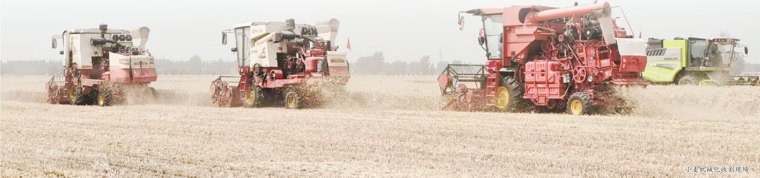
小麦机械化收割现场。