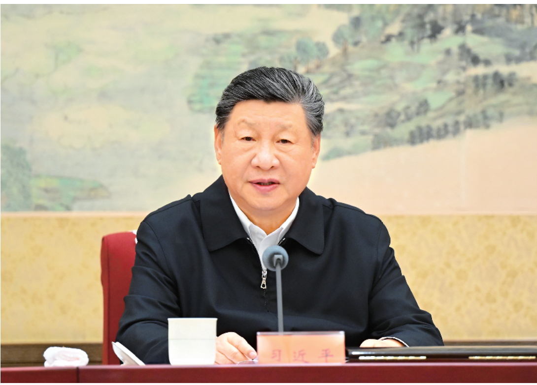
12 月 25 日至 26 日，中共中央政治局召开民主生活会，中共中央总书记习近平主持会议并发表重要讲话。