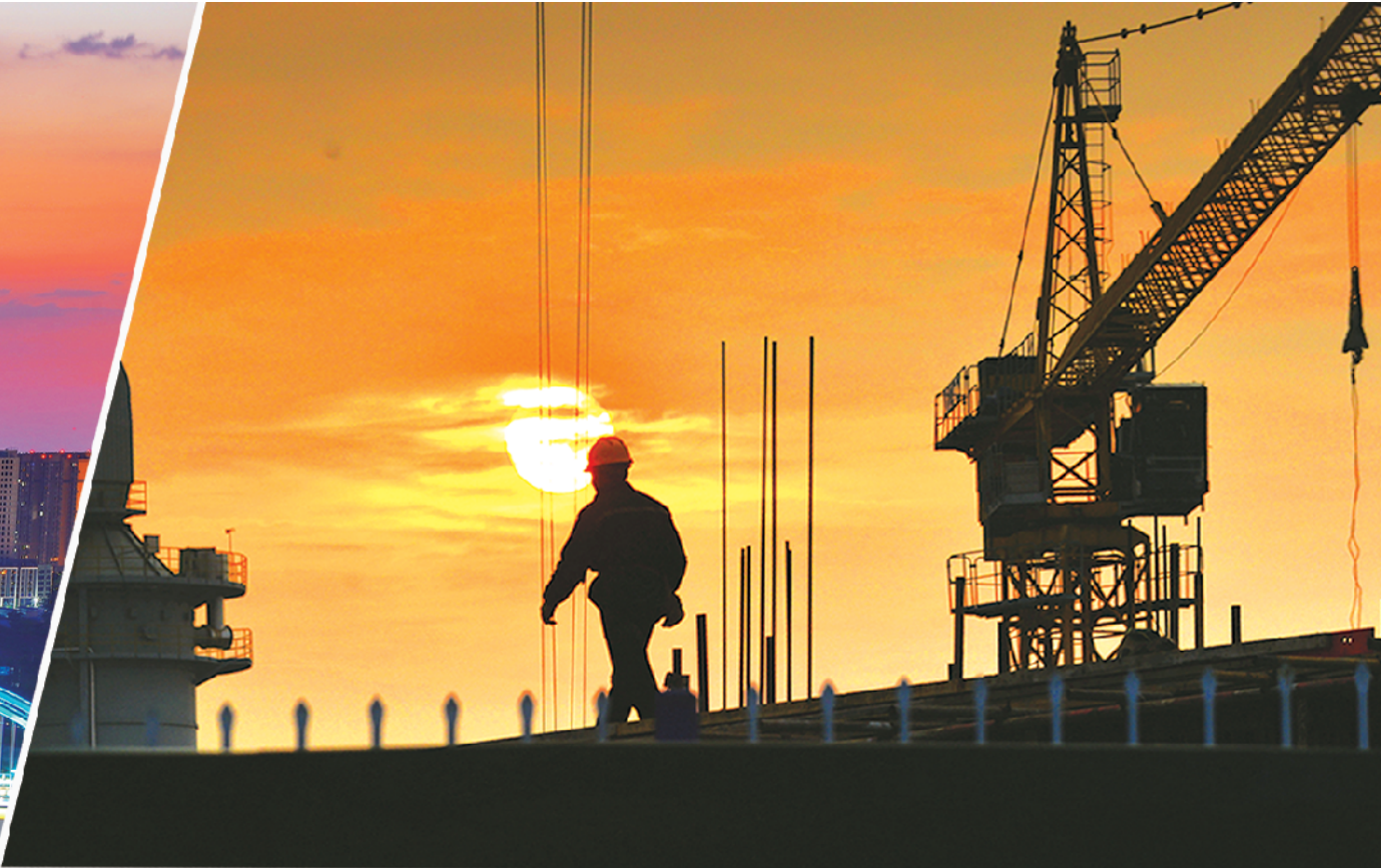
迎着朝阳,建设者工作在一线。