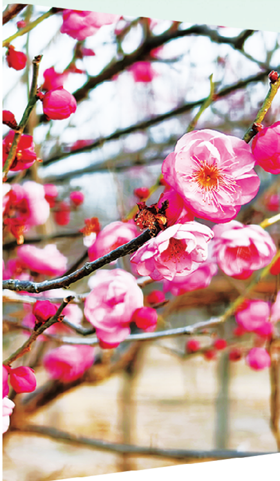
梅花迎着凛冽的寒风怒放。