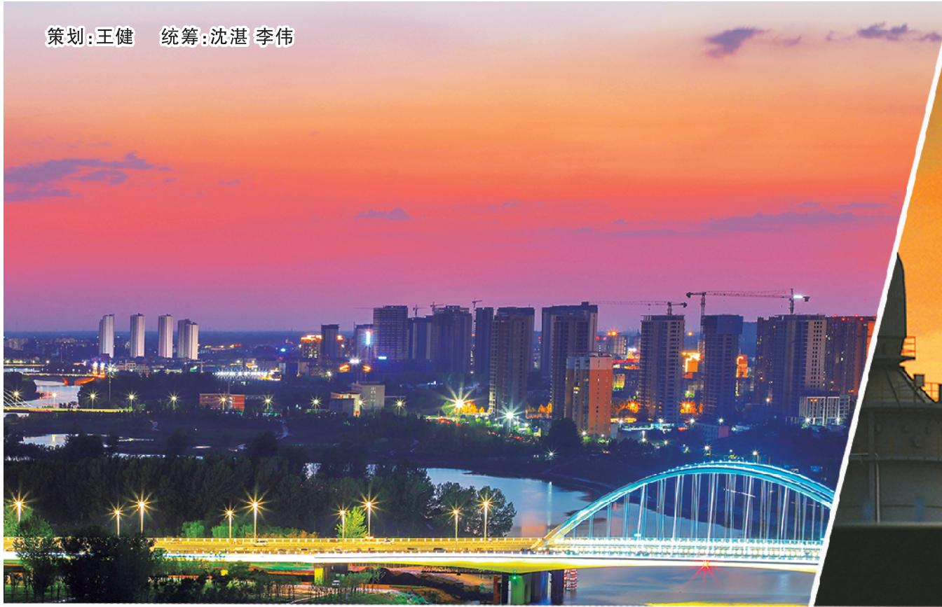
入夜,河水静静流过中心城区,城区如一幅唯美的画卷。