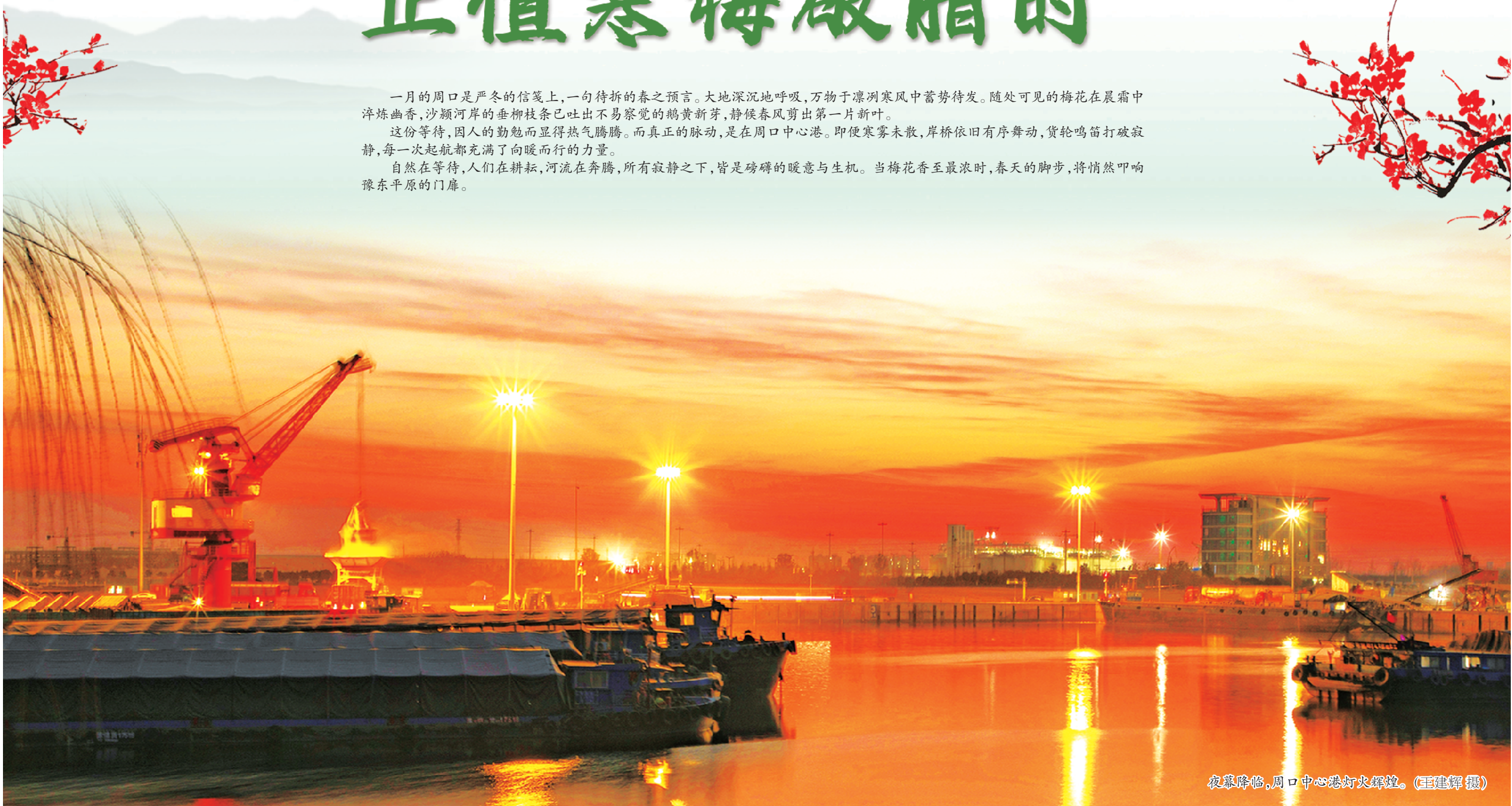
夜幕降临,周口中心港灯火辉煌。

一月的周口是严冬的信笺上,一句待拆的春之预言。大地深沉地呼吸,万物于凛冽寒风中蓄势待发。随处可见的梅花在晨霜中淬炼幽香,沙颍河岸的垂柳枝条已吐出不易察觉的鹅黄新芽,静候春风剪出第一片新叶。 这份等待,因人的勤勉而显得热气腾腾。而真正的脉动,是在周口中心港。即便寒雾未散,岸桥依旧有序舞动,货轮鸣笛打破寂静,每一次起航都充满了向暖而行的力量。 自然在等待,人们在耕耘,河流在奔腾,所有寂静之下,皆是磅礴的暖意与生机。当梅花香至最浓时,春天的脚步,将悄然叩响豫东平原的门扉。