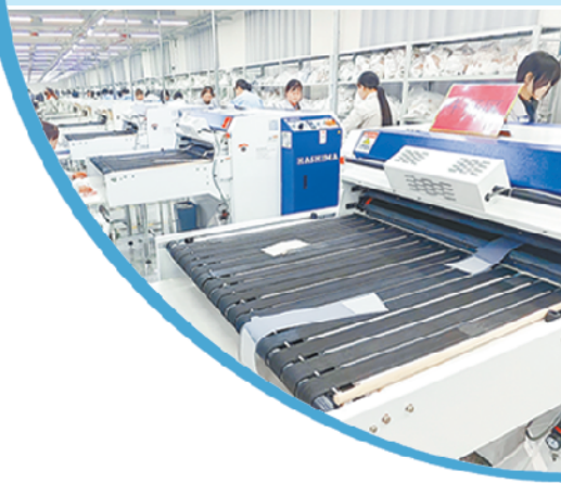
▼阿尔本制衣生产车间一片繁忙。

“三个绝不允许”——绝不允许乱检查、乱收费、乱罚款。在专项督导方面,积极开展涉企行政执法“百日攻坚”行动,重点核查执法单位行动方案制订、“双专班”机制建立、第一责任人履职等情况,发现问题当场指导整改。在线索征集方面,利用电子邮箱、投诉电话等,面向社会公开征集执法不公、越权执法、吃拿卡要等问题线索,确保行政执法在阳光下运行。