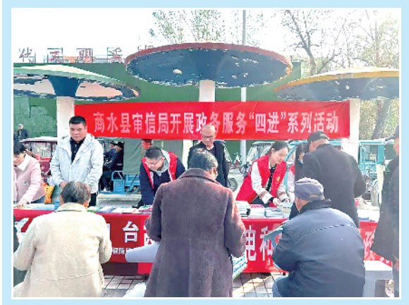
►政务服务“四进”活动现场。