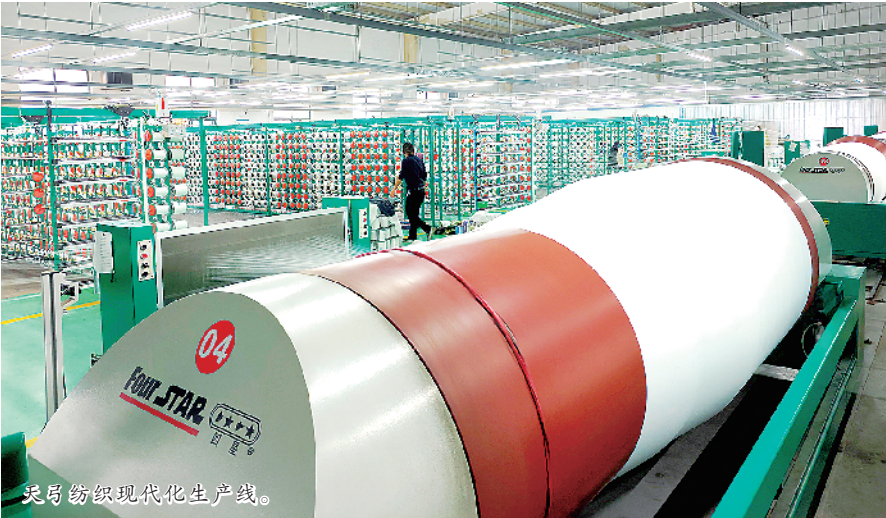
天弓纺织现代化生产线。