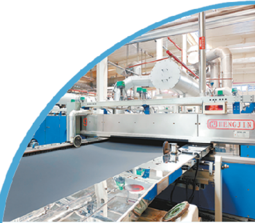
▲红绿蓝印染高效能生产线。

贯穿其中、成为各级干部行动自觉的,正是“不叫不到、随叫随到、服务周到、说到做到”的“四到”精神。“不叫不到”是底线思维,体现对市场规律的尊重和对企业经营自主权的呵护;“随叫随到”是责任担当,确保企业遇困时响应“零延迟”;“服务周到”是工作标准,致力于提供全链条、贴心式的服务体验;“说到做到”是诚信基石,让每一项惠企承诺都落地生根。恒力攻坚,终成佳绩。如今,“四到”精神已深深融入商水县优化营商环境的血脉,贯穿于