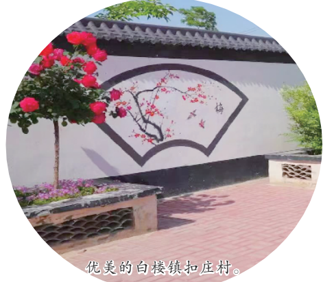
优美的白楼镇扣庄村