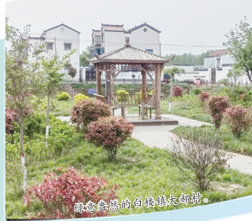
绿意盎然的白楼镇大郭村