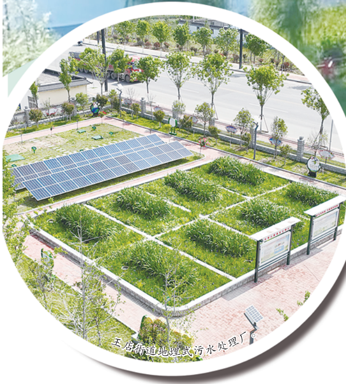
王店街道地理式污水处理厂