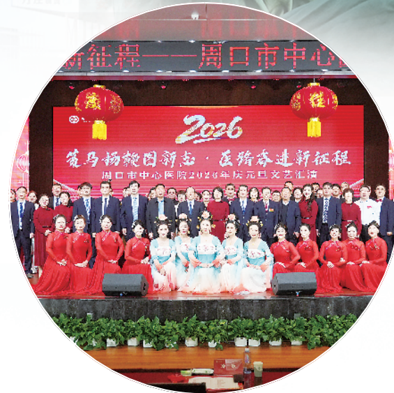
周口市中心医院举办2026年度元旦文艺汇演。

央视镜头记录的,不只是先进的设备、精湛的技术、高效的流程,更有周口市中心医院深植血脉的文化力量与人文温度。 “厚德精医、仁爱为民”,这八字院训镌刻在周口市中心医院的每一个角落,融入每一位医护人员的言行。周口市中心医院始终坚持“以患者为中心、以员工为核心”的管理理念,以文化塑院,以文化聚力,以文化育人,既有治病救人的专业力量,更有温暖人心的人文情怀。 对患者,周口市中心医院不止于“治好病”,更致力于“少生病,晚生病”。常态化开展健康宣教、社区义诊、慢性病管理和医患互动活动,连年举办健康科普大赛,选拔优秀科普人才,创作通俗易懂、接地气、实用性强的科普作品。利用天井、走廊等公共空间,匠心打造法治文化园、特色专科长廊、健康科普长廊,使健康文化深入人心。依托微信公众号、视频号、抖音号等新媒体平台打造健康科普矩阵,定期推送防病知识、急救常识、用药指导和养生常识,在润物无声中提升全民健康素养,构建和谐医患关系。 对员工,周口市中心医院用心用情打造温暖家园。推行“节日有礼、温情相伴”的节日文化,春节送祝福,中秋送关爱、医师节致以敬意、护士节送上关怀,丰富多彩的活动让职工在紧张工作之余舒缓压力、愉悦身心。切实关心职工成长、保障职工权益、解决职工困难,从职业发展至生活保障,从身心健康到家庭关怀,全方位增强职工的归属感、幸福感和职业荣誉感。 幸福的员工,才能提供有温度的服务;安心的团队,才能守护好百姓健康。2025年职工满意度调查显示,周口市中心医院职工满意度达98.3%,远超全国三级医院平均水平。稳定而优秀的人才队伍,向上而奋进的团队氛围,促进医疗质量与服务水平持续提升,形成“患者满意、职工幸福、医院发展”的良性循环。 一次次高光亮相,不是偶然,而是厚积薄发;一项项亮眼成绩,不是终点,而是全新起点。 “我们将始终坚持‘学科立院、科技兴院、人才强院、管理精院、文化塑院’的发展理念,锚定建设技术先进、服务优质、群众满意、职工幸福、全省一流现代化医院标杆的目标,一步一个脚印、一年一个台阶,奋力推动医院高质量发展再上新台阶。”周口市中心医院党委书记、院长冷冰话语坚定、信心满怀。 新时代新征程,周口市中心医院将继续深化公立医院改革,加快智慧医院建设,推进远程医疗服务,推动优质医疗资源扩容下沉、均衡布局,持续优化服务流程,提升医疗质量、涵养医德医风、厚植文化底蕴,以更精湛的技术、更优质的服务、更饱满的热情、更务实的作风,守护一方百姓安康,书写健康周口、健康河南的崭新篇章,让医者初心在坚守中闪光,让民生温度在实干中传递!