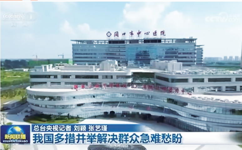
CCTV-13《新闻联播》“我国多措并举解决群众急难愁盼”专题使用周口市中心医院文昌路院区画面。

医疗卫生事业事关民生福祉,事关发展大局,是衡量一座城市温度与实力的重要标尺。2025年,周口市中心医院一年内五次亮相中央电视台,从便民就医到区域医疗中心建设,从急诊急救到医者仁心故事,成为全国地市级公立医院高质量发展的鲜活典型。其背后,是坚守为民初心的情怀,是精益求精的技术追求,是党建引领的坚强保障,是文化铸魂的内生力量。今日本报推出深度报道,全景展现周口市中心医院的奋进足迹与发展密码,为全市医疗卫生事业高质量发展提供示范、凝聚合力。