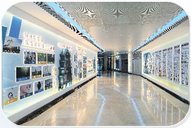
门诊走廊设立健康科普长廊,让患者在候诊过程中轻松获取实用医学常识。