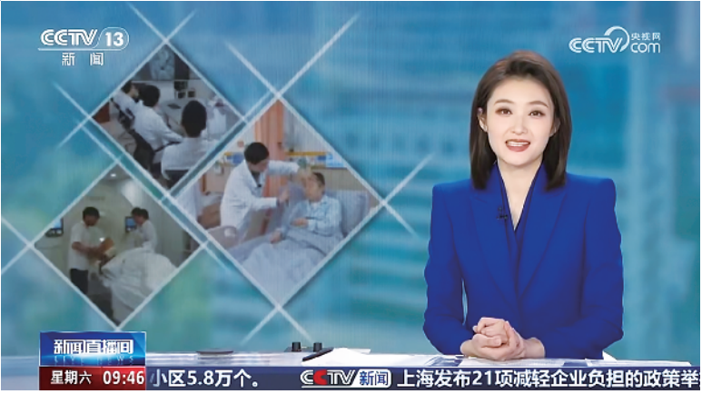
CCTV-13《新闻联播》报道周口市中心医院省区级区域医疗中心建设情况。