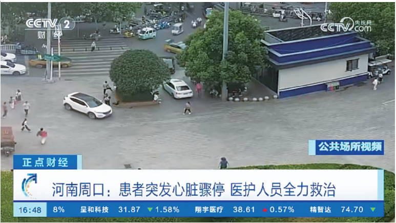
CCTV-2《正点财经》报道周口市中心医院人民路院区急诊急救中心医护人员在患者突发心脏骤停后,实施高效急救、成功挽救生命的全过程。