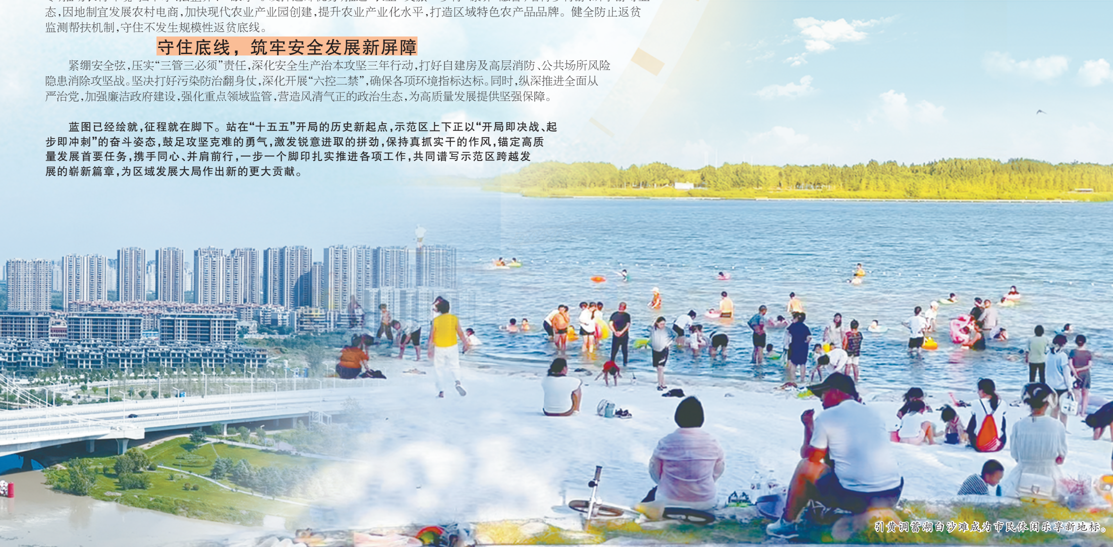
引黄调蓄湖沙滩成为市民休闲游乐新地标。