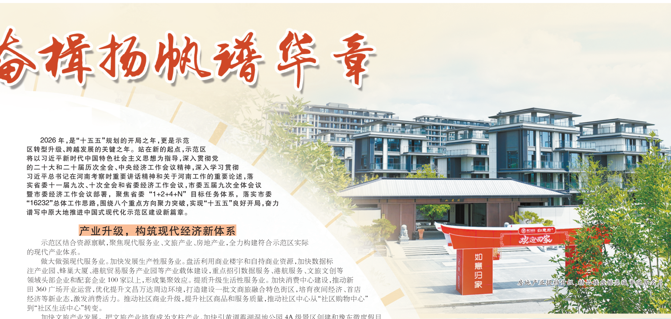
示范区建设新进展,高品质住宅项目即将交付。