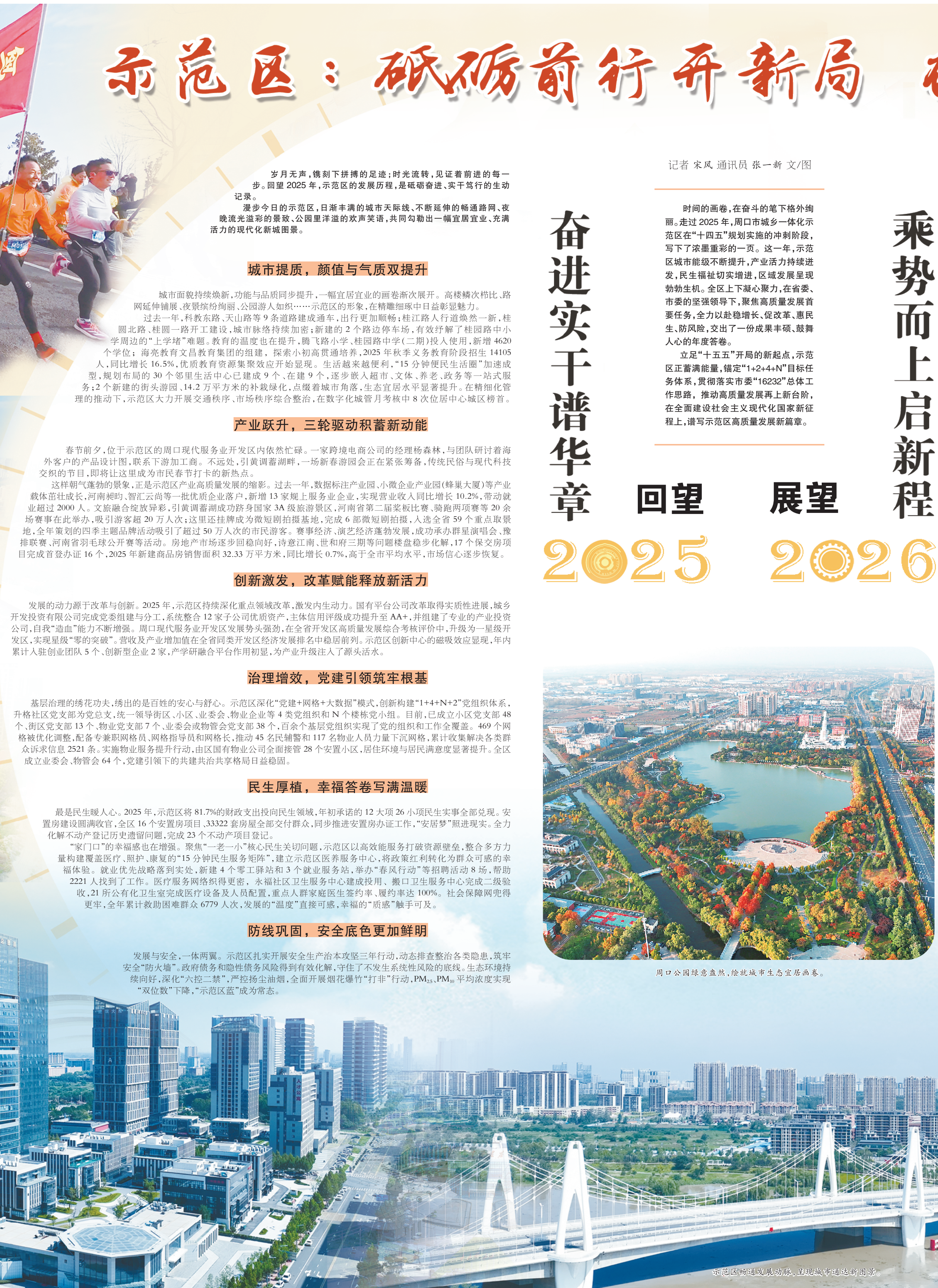
示范区街道纵横交错,呈现城市通达新图景。