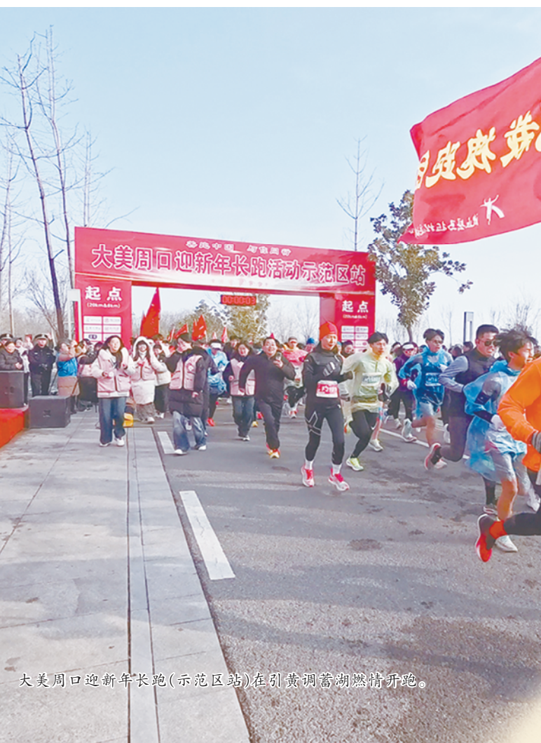
大美周口迎新长跑(示范区站)在引黄调蓄湖鸣枪开跑。

蓝图已经绘就,征程就在脚下。站在“十五五”开局的历史新起点,示范区上下正以“开局即决战、起步即冲刺”的奋斗姿态,砥砺攻坚克难的勇气,激发锐意进取的拼劲,保持真抓实干的作风,锚定高质量发展首要任务,携手同心、并肩前行,一步一个脚印扎实推进各项工作,共同谱写示范区跨越发展的新篇章,为区域发展大局作出新的更大贡献。