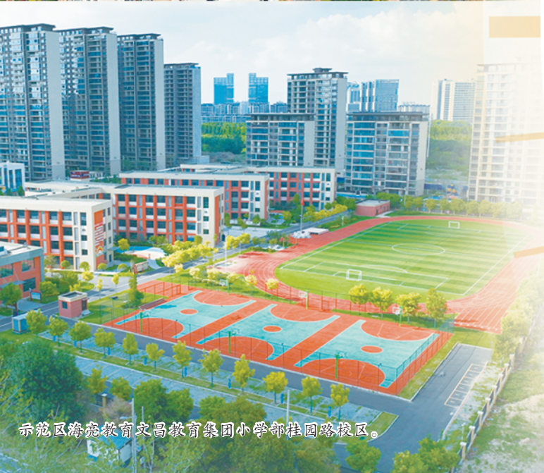
示范区的体育大课间,孩子们在操场上尽情奔跑。