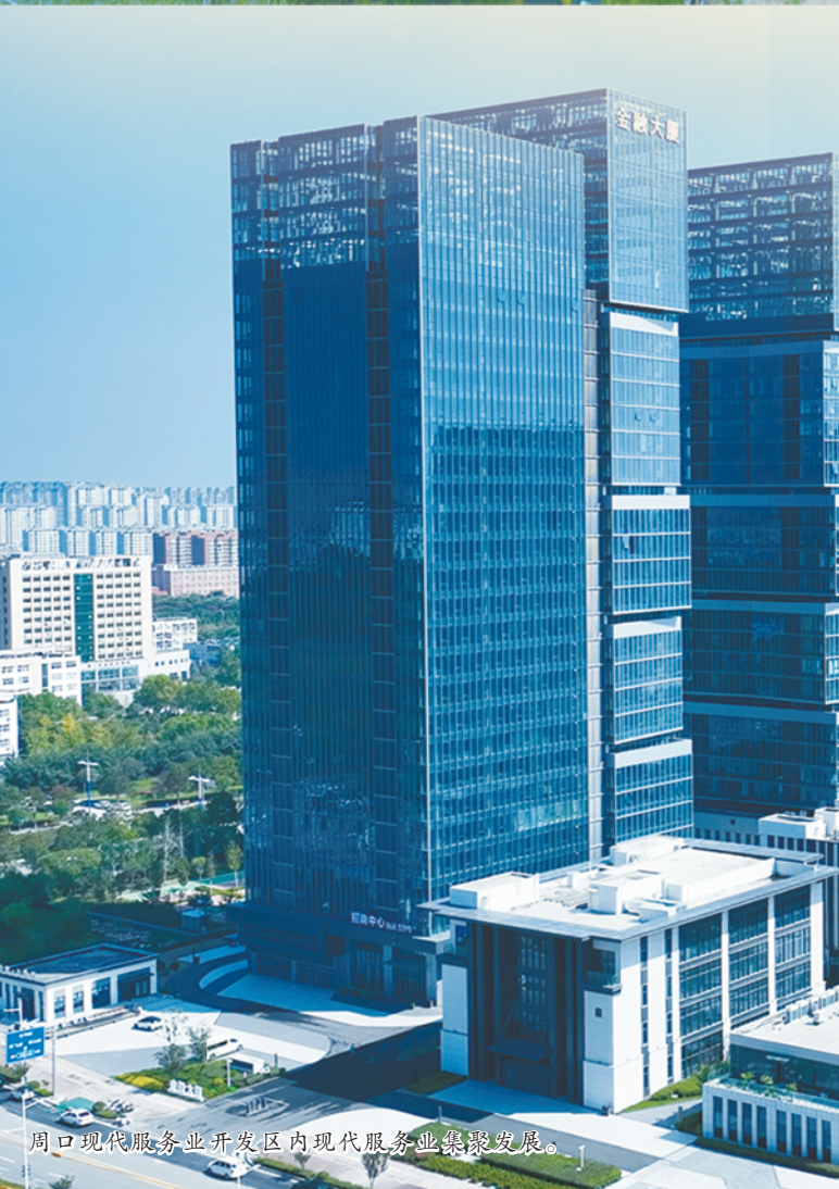
周口现代服务业开发区内现代服务业综合体。