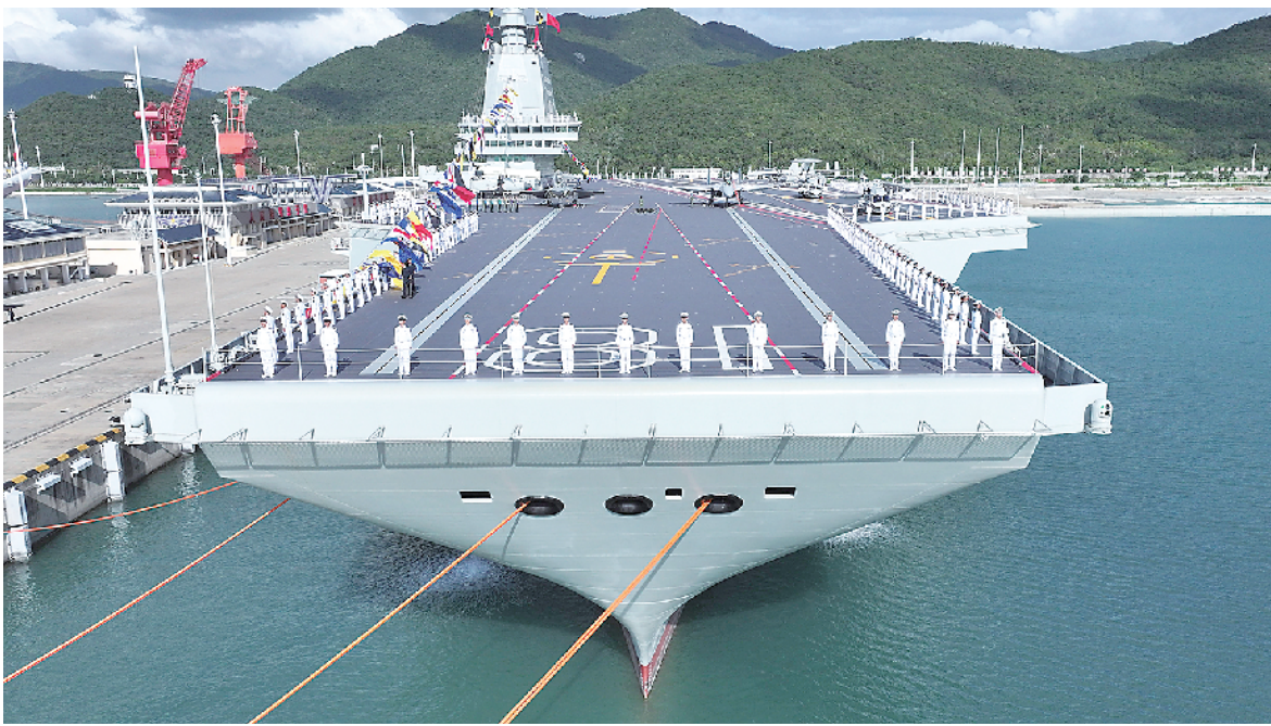
2025年11月5日，我国第一艘电磁弹射型航空母舰福建舰入列授旗仪式在海南三亚某军港举行。