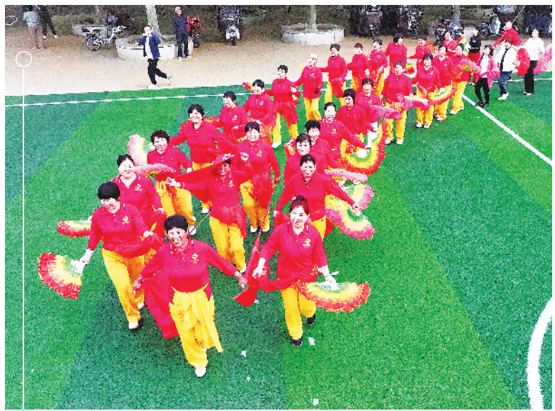
4月25日早晨,项城北公园热闹非凡。在“活力拍拍团”举办的趣味健身活动中,拍花轿、拔河等项目精彩纷呈。这项趣味健身活动已开展一年多,持续传递活力与温暖。图为“活力拍拍团”表演扇子操。