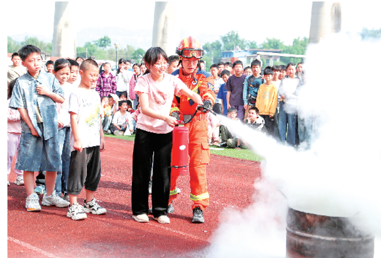
5月11日,四川省华蓥市的消防员在阳和镇小学指导小学生用干粉灭火器灭火。在第18个全国防灾减灾日到来之际,多地开展防灾减灾知识普及和应急演练等活动,进一步强化人们应急避险与安全自救能力。

据悉,天舟十号将在空间站停留约12个月,期间配合空间站完成轨道及姿态调整、开展空间科学试验。从“一”到“十”,航天人用匠心与实干,一次次书写着奔赴星辰大海的从容与坚定。(新华社北京5月11日电)