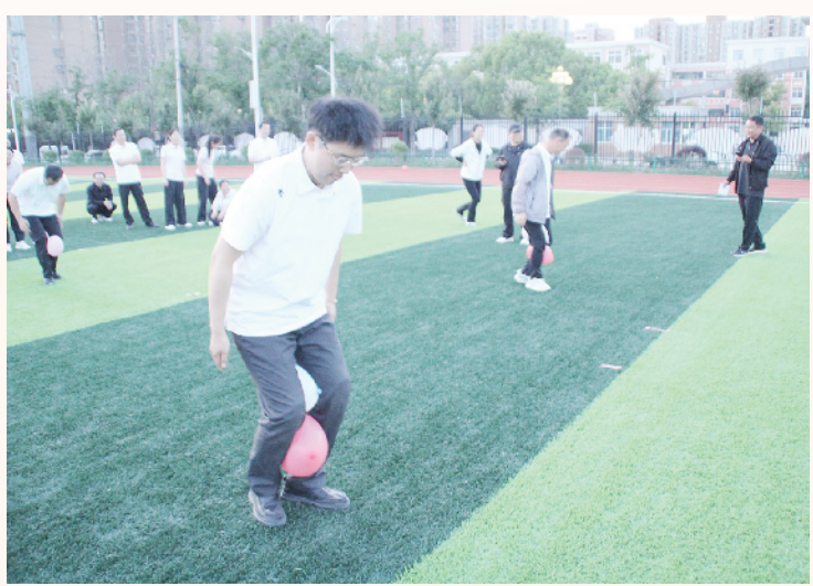
近日,农行淮阳支行举办2026年员工趣味运动会。本次员工趣味运动会旨在丰富员工的业余生活,深化“一家人、一条心、一起干、共成长”的家园文化理念。图为员工趣味运动会现场。张继平 王超 摄