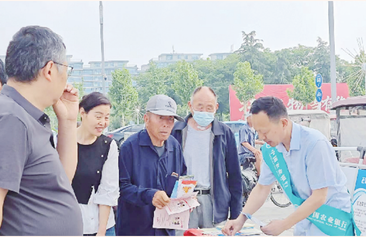
5月15日,农行扶沟县支行开展“5·15”打击和防范经济犯罪宣传日活动。该支行员工用通俗易懂的语言向群众讲解电信网络诈骗、非法集资、洗钱等常见犯罪手法和防范要点。