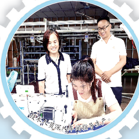
技术人员深入车间指导生产。