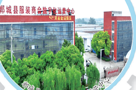
郸城县服装商会数字化运营中心。