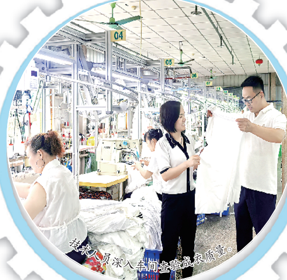
技术人员深入车间检查服装质量。