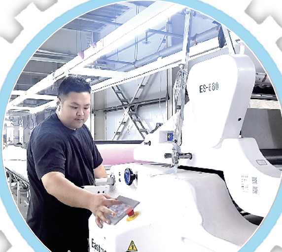
裁缝利用自动化裁床裁剪面料。