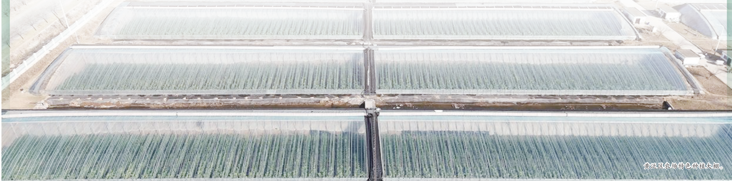
黄泛区农场特色种植大棚。