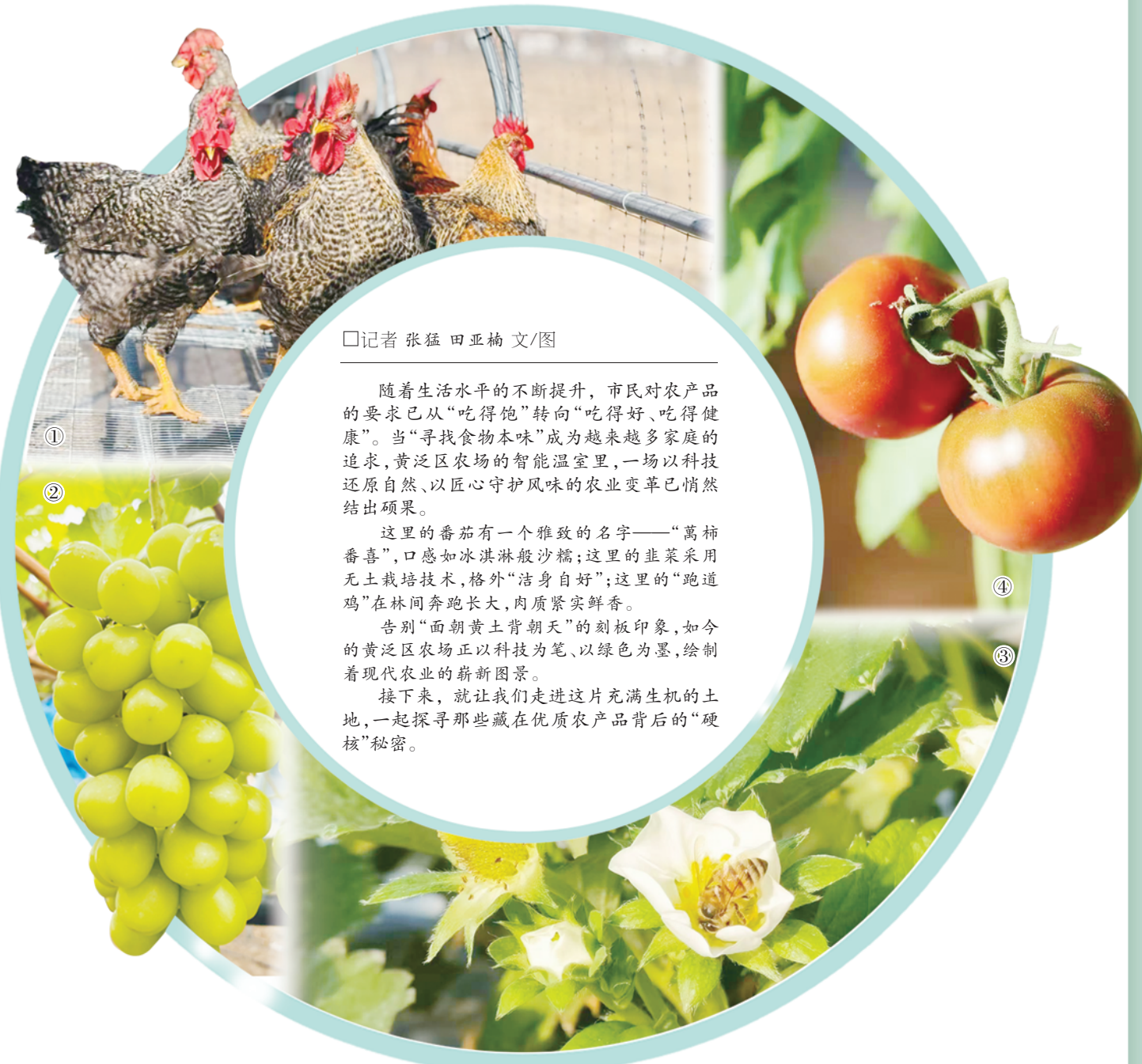
□记者 张猛 田亚楠 文/图

黄泛区农场对土地的敬畏与呵护,最终转化为消费者口中那纯粹的甘甜。对绿色标准的执着,让水果番茄、草莓、西瓜等产品接连获得“绿色食品认证”及“豫农优品”称号。严苛的品控更是赢得了市场和消费者的口碑。当普通韭菜因农残问题让人担忧时,黄泛区农场的水培韭菜却以每斤40元的价格畅销北京、上海,甚至出口国外。依托先进的水培技术,这里的韭菜真正实现洁净无污染,割一茬长一茬,成了高端餐桌上的“常客”。