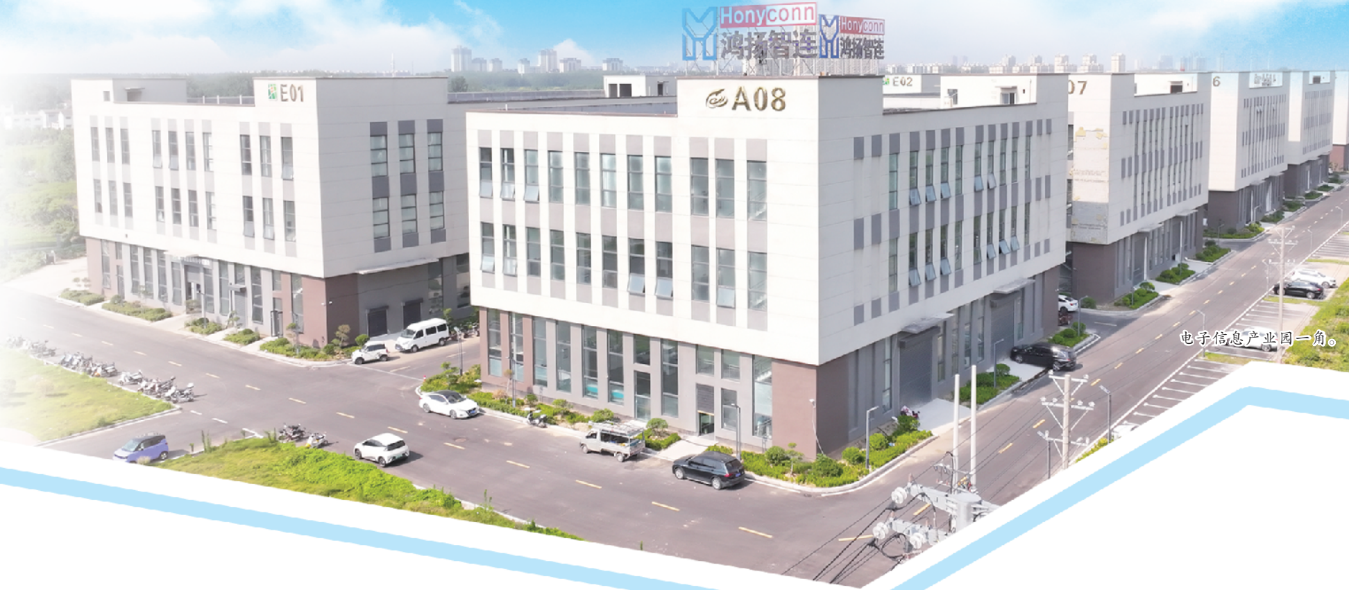
电子信息产业园一角。

西华县严格落实市委“16232”总体工作思路,立足资源禀赋和产业根基,深耕精准招商、链式招商、服务留商,聚力做强智能零部件制造、食品加工两大主导产业。随着一批体量大、质效优、带动性强的项目落地生根,西华县产业版图加速重构,发展动能持续汇聚,经济高质量发展迈出坚实步伐。