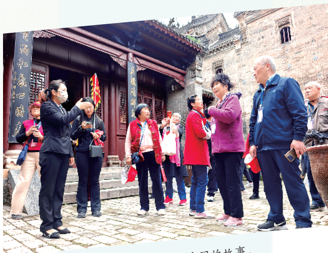
导游为游客讲解叶氏庄园的故事。