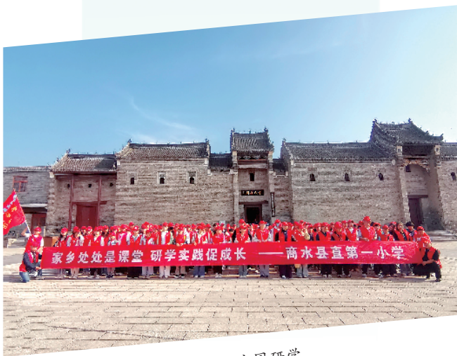
学生到叶氏庄园研学。