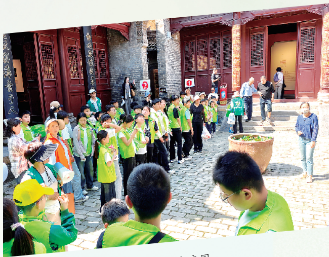
师生参观叶氏庄园。