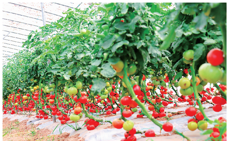
大棚里的小番茄鲜嫩欲滴。

更深刻的变革在田间地头。记者看到,在扶沟县蔬菜路两侧,跨度15米、长40米的第12代温室大棚成为标配。安冠智慧农业产业园的43座“海容模块温室”抗风抗雪,土地利用超85%;大有兴业(扶沟)现代农业产业园占地1800亩,规划建设100万平方米全智能温室、2万平方米冷链仓储集配中心,其数字孪生平台与AI决策系统实时监控。(下转第二版)