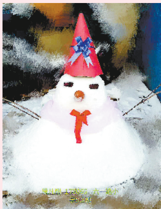
小记者:周凡翔 编号:172065 学校:周口六一路小学五(2)班