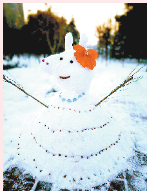
小记者:王一童 编号:171993 学校:周口六一路小学四(5)班

2018年元旦刚过就迎来初雪,1月3日,本报推出“童真童趣 个性雪人”堆雪人活动,小记者发动自己的奇思妙想,堆出了有个性的创意雪人,本期推出部分作品(其他详见小记者微信公众号)。