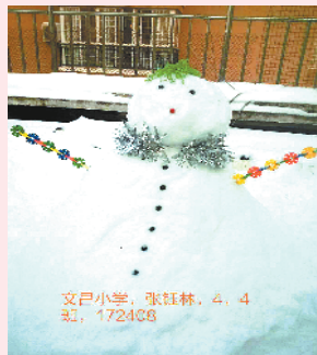
小记者:张钰林 编号:172408 学校:周口文昌小学四(4)班