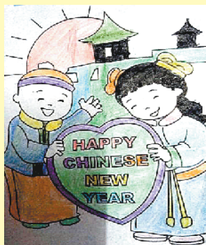
小记者:陈明辉 编号:171726 学校:周口六一路小学二(3)班