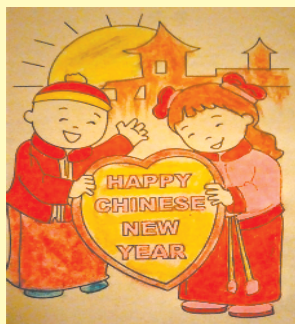
小记者:蒋露 编号:171053 学校:周口实验小学四(2)班