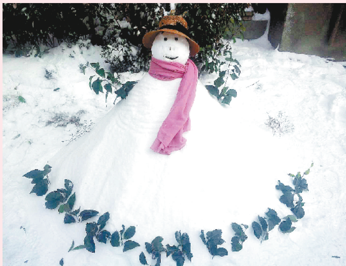
▲小记者:刘筱萱 编号:172011 学校:周口六一路小学四(6)班