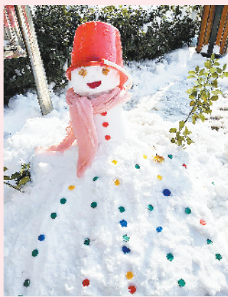
小记者:孟怡霖 编号:170763 学校:周口四中七(8)班