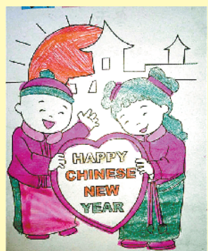
小记者:王思瑶 编号:170648 学校:周口实验小学二(1)班