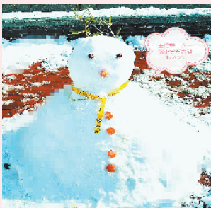
◀小记者:王怡宁 编号:172021 学校:周口六一路小学五(6)班