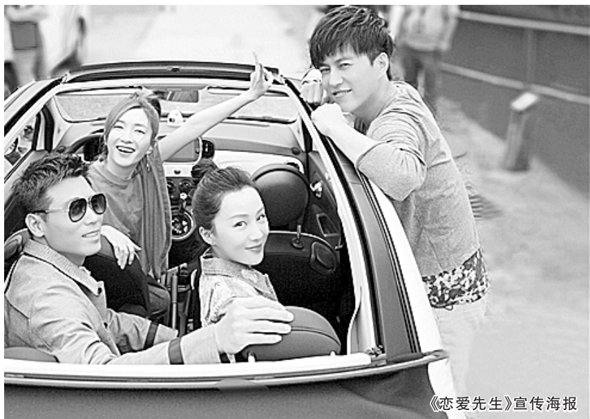
《恋爱先生》宣传海报