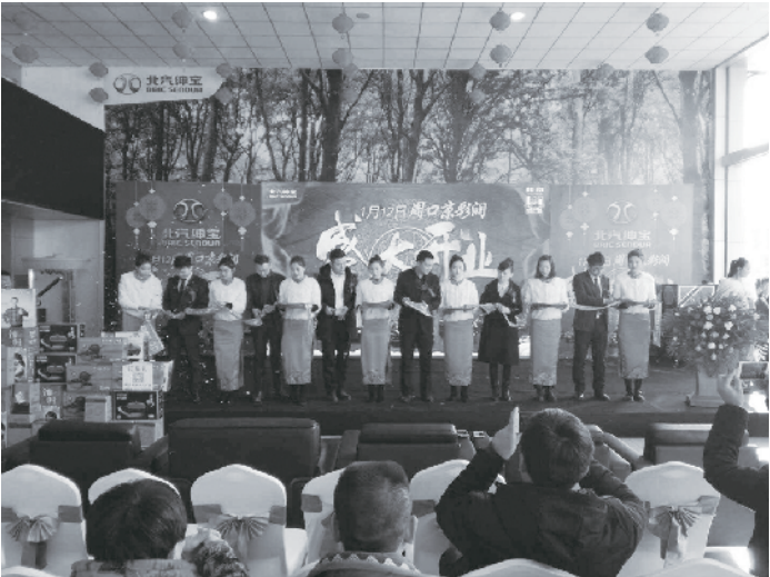
1 月 12 日, 北汽绅宝周口京彩润 4S 店开业盛典在车之港国际车城隆重举行。来自北汽绅宝的厂家领导、BJ40 越野大队、新老客户以及周口主流媒体记者悉数到场, 共同见证了这一喜庆时刻。

车有一个安全有效的距离。 在寒冷的冬季, 汽车成为我们外出时温暖的避风港。在低温天气、风雪交加时, 对爱车的呵护才能让其平安过冬, 避免低温给爱车造成不利影响。同时, 我们更应该掌握如何在冬季安全驾驶, 更为重要。希望以上内容对各位的爱车健康状况有所帮助。切记, 冬季要更注意行车安全! (据新华网)