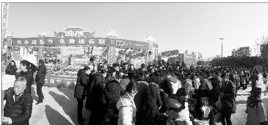
等待领取春联的市民