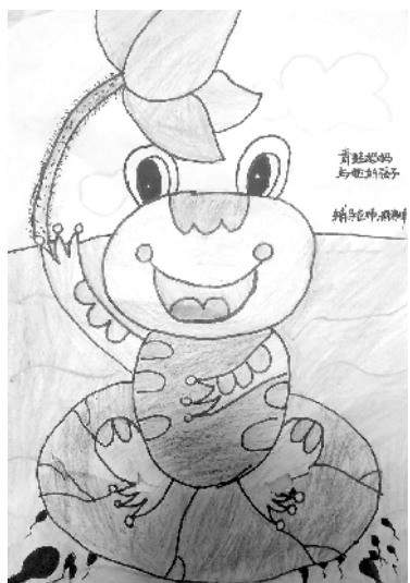
小记者:杨特 编号:185255 西华县西关小学二(3)班