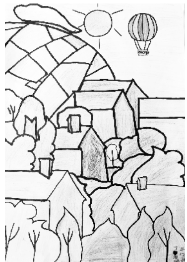
小记者:丁决旭 编号:185137 西华县人和路小学二(2)班