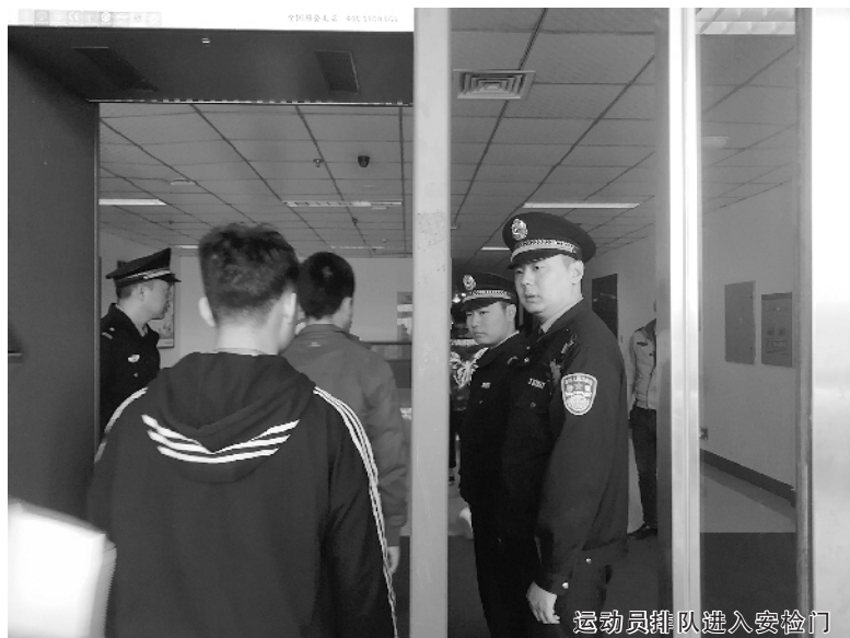
运动员排队进入安检门

据周口市治安支队民警张鑫介绍,为了能够做好本届省运会的安保工作,周口市公安局文昌分局的干警负责比赛场馆内的安保工作;周口市公安局特殊勤务支队出动巡逻车和警用摩托在市体育馆外围区域维持秩序,处理突发事件;交警则在一些易拥堵路段疏导交通,保证运动员能够按时到达比赛场地。⑥