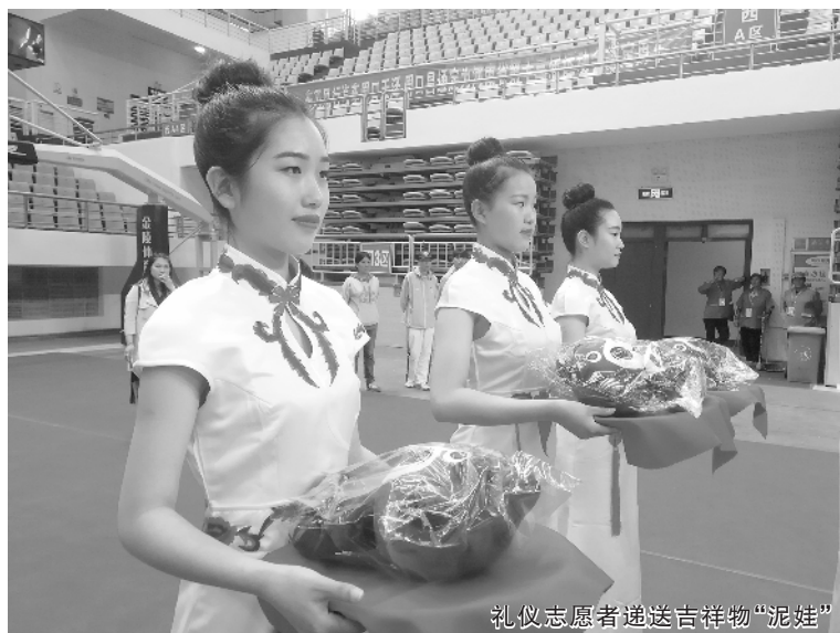
礼仪志愿者递送吉祥物“泥娃”