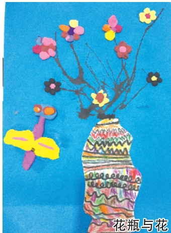
花瓶与花 小记者:周乘颜 编号:181339 周口七一路一小一(4)班