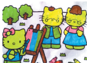
小记者:沙子琪 编号:181195 周口闫庄小学一(2)班