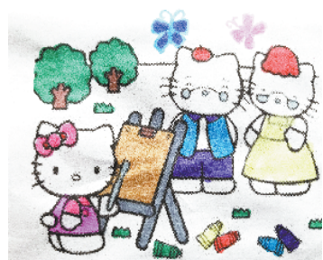
小记者:郑依果 编号:181209 周口闫庄小学三(6)班