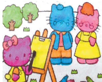
小记者:谢潇莹 编号:181591 周口七一路一小二(3)班