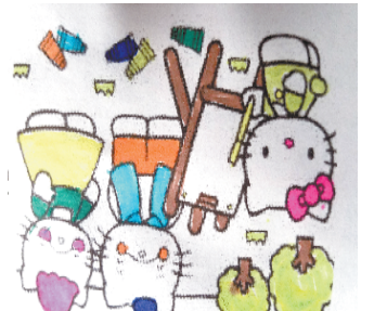
小记者:贾煊一 编号:180485 周口七一路二小二(5)班