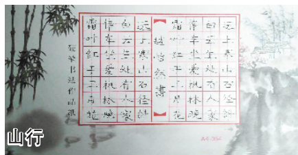
小记者:赵怡然 编号:180815 周口六一路小学一(7)班

本栏目刊发小记者的书法、绘画、摄影等作品。小记者们如果有这些爱好,快快拿起手中的笔开始创作吧!作品创作完成后,请用相机拍下来发送到 zkwbxjz@126.com