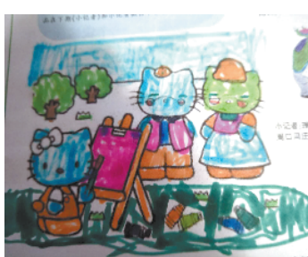
小记者:郭汶东 编号:180972 周口实验小学一(1)班