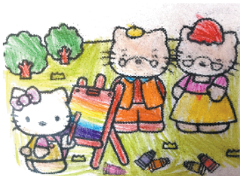
小记者:单笑笑 编号:180977 周口实验小学一(1)班