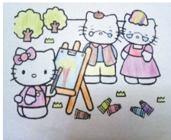
小记者:胡舒雅 编号:181806 周口闫庄小学一(1)班