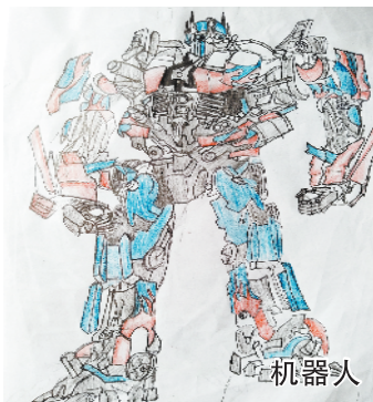
机器人 小记者:马超然 编号:180897 周口六一路小学三(7)班