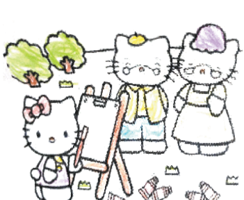
小记者:张浩然 编号:180823 周口六一路小学二(2)班