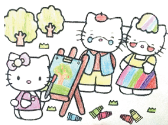
小记者:李若冰 编号:180859 周口六一路小学三(2)班