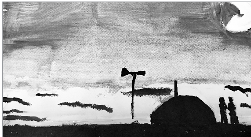
小记者:郭智越 编号:185276 西华县西关小学四(2)班