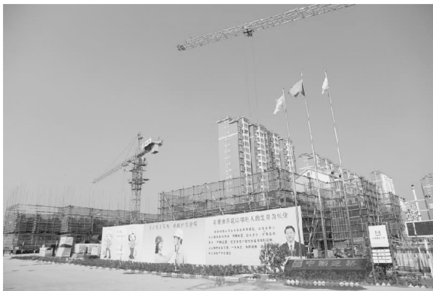
建设中的东新区盛和家园棚改项目