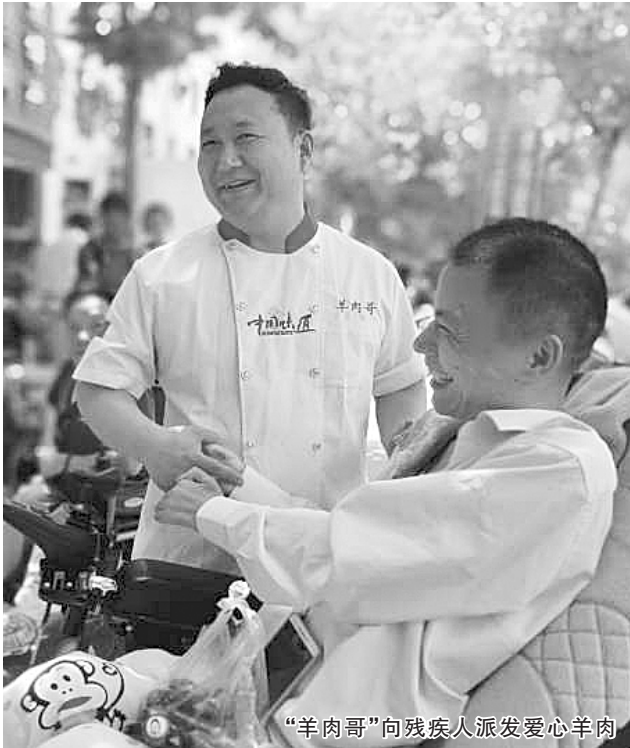
“羊肉哥”向残疾人派发爱心羊肉