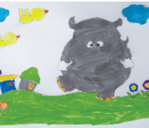
小记者:王烁 编号:188008 周口七一路二小五(4)班