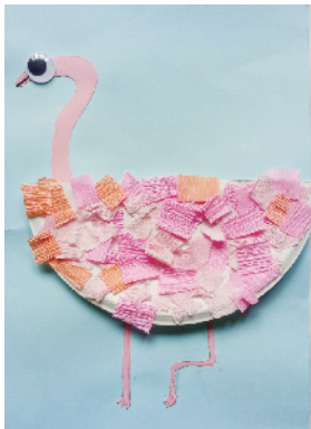
小记者:迟岚兮 编号:181020 周口实验小学二(1)班