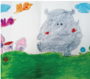
小记者:理竞玉 编号:181227 周口闫庄小学一(6)班

小记者,你是否常常想画一幅漂亮的画,可是却苦于无从下笔?本期开始,小记者填色游戏火热来袭,小伙伴们快来填涂属于自己的“秘密花园”吧。作品涂好后,可用相机或者手机将其拍下来发至 zkwbxjz@126.com,写清姓名、编号、学校班级,请注意图片格式和清晰度,本报将选取较好的作品在下期《小记者报》和小记者微信平台集中展示。