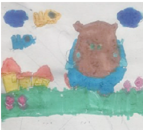
小记者:张之申 编号:180741 周口六一路小学一(3)班