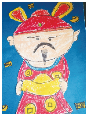
小记者:李牧青 编号:180762 周口六一路小学一(4)班