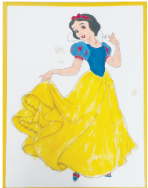
小记者:高雅萱 编号:187269 项城市文化路小学三(7)班