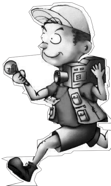
小记者:贺宝婕 编号:186402 商水县直一小四(2)班

我有过许多个第一次,第一次骑自行车、第一次洗衣服、第一次做饭……但第一次体验小记者现场采访,更让我记忆犹新。