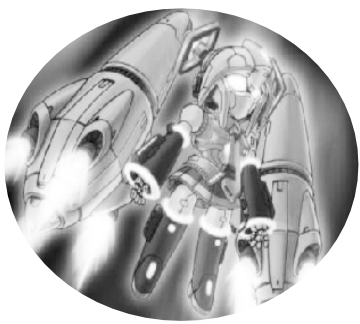
小记者:孙雨泽 编号:180866 六一路小学三(3)班