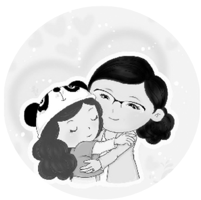
小记者:马超然 编号:180897 周口六一路小学三(7)班