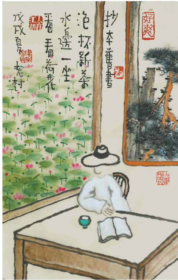
抄本旧书，泡杯新茶。 水边一坐，看看荷花。 老树画画