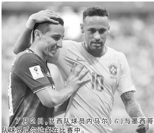
7月2日，巴西队球员内马尔（右）与墨西哥队球员瓜尔达多在比赛中。

作为巴西队核心，内马尔本届杯赛经常受到对手的照顾，频繁倒地还被赋予了新名词“内马尔滚”。但在梅西、C罗相继告别之后，内马尔用强势表现昭示世人他要留下，他和巴西队也成了赛事