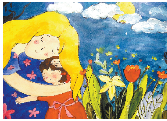
小记者:郭宸 编号:180689 周口六一路小学四(5)班