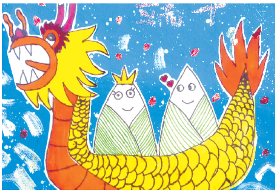
小记者:迟岚兮 编号:181020 周口实验小学二(1)班