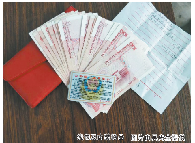
钱包及内装物品