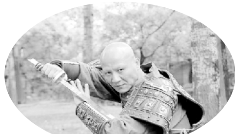
计春华在《少林寺》里出演大反派秃鹰

本报综合消息 著名武打演员计春华先生于7月11日上午10时35分因病在杭州去世,终年57岁。计春华的突然离世,让不少业内同行感到震惊和惋惜。