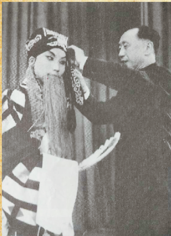
马连良为申凤梅扮戏。

京剧老生泰斗马连良看了申凤梅演出的《收姜维》后,惊喜非常,要收申凤梅为徒。首都文艺界40多位知名人士参加了申凤梅的拜师仪式。名师高徒,一时在剧坛被传为佳话。