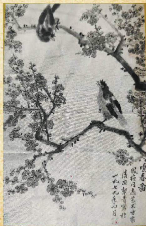
老舍夫人、著名画家胡絮青为申凤梅画《鸣春图》。

1963年,申凤梅拜师会上,首都文艺界40多位知名人士签名留念。其中有京剧表演艺术家马连良、袁世海、裘盛戎、张君秋、谭富英、马富禄、李慕良,著名电影表演艺术家赵丹、崔嵬,著名电影导演陈怀皑,京剧导演阿甲,相声大师侯宝林,著名作家老舍、曹禺、李准、于黑丁,原北京电影制片厂厂长汪洋等。