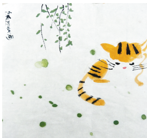
小记者：梁淇萱 编号：181809 周口闫庄小学二(5)班