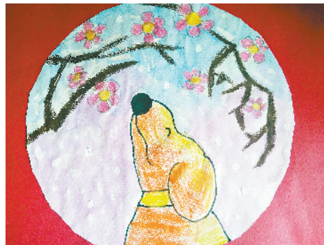
小记者：李牧青 编号：180762 周口六一路小学一(4)班

本栏目刊发小记者的书法、绘画、摄影等作品。小记者们如果有这些爱好，快快拿起手中的笔开始创作吧！作品创作完成后，请用相机拍下来发送到 zkwbxjz@126.com