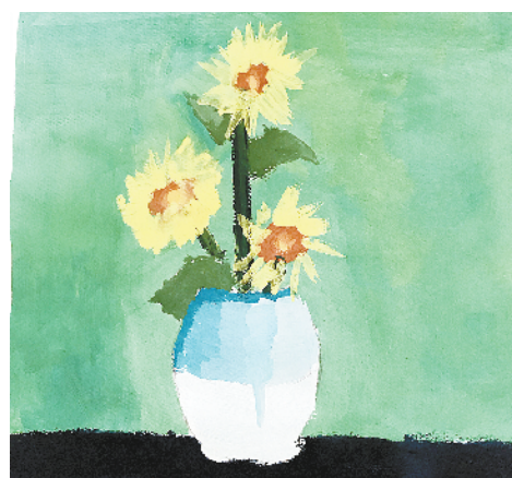
小记者：郑依果 编号：181209 周口闫庄小学三(6)班