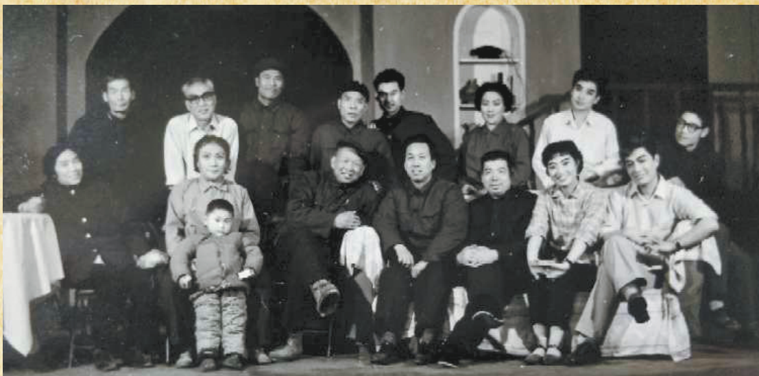
《于无声处》全体演员合影。