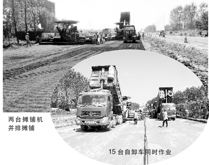
两台摊铺机 并排摊铺