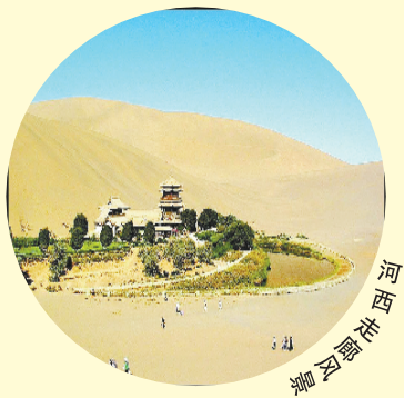
河西走廊:重温丝绸古道

大西北地区之所以成为自驾游的首选路线,在于秋季里少雨少雾,且交通相对通畅。最为重要的是秋天蔬菜、瓜果等开始成熟,沿途的风景很有看头。