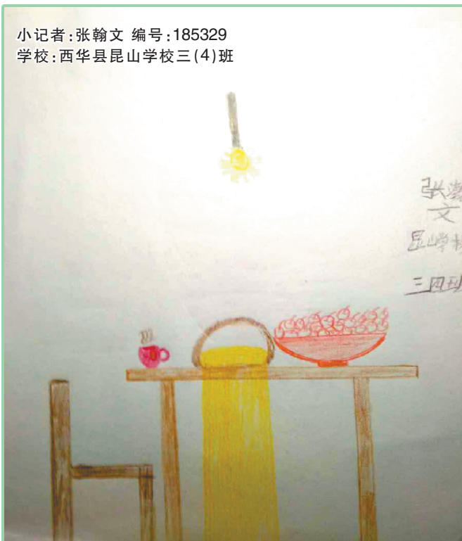
小记者:张翰文 编号:185329 学校:西华县昆山学校三(4)班