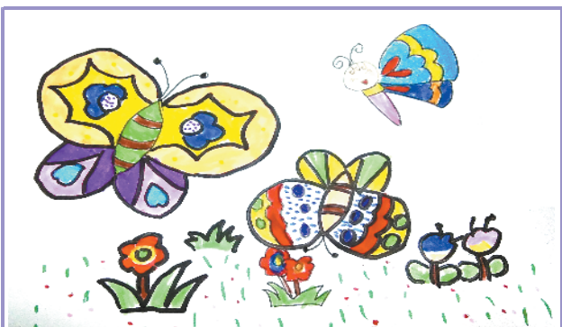
小记者:张佳瑞 编号:185009 学校:西华县人和路小学一(1)班