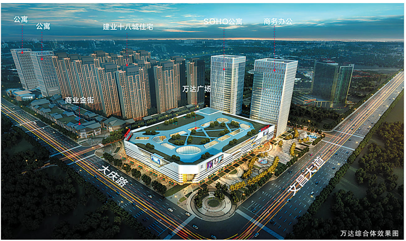
万达综合体效果图

在新技术变革下，城市升级由商业驱动，城市商业是现代城市发展的助燃剂，是城市升级的重要引擎。2018年，周