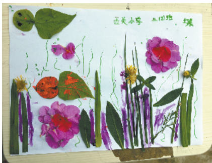
小记者:王丁晨 编号:185239 西华县西关小学三(2)班