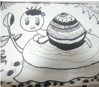
小记者:张佳瑞 编号:185099 西华县人和路小学二(2)班