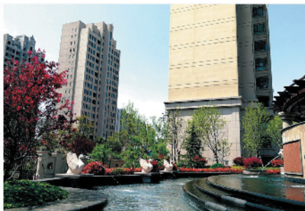
雅致的上尊社区(实景拍照)