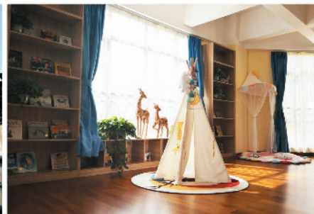
上尊爱弥儿现代幼儿园(实景拍照)

物业坐落:周口市大庆路与建设大道交会处(中悦·上尊) 尊享VIP:0394-8896 999