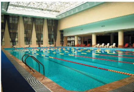
宽敞恒温泳池(实景拍照)